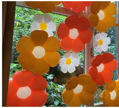
Blumendeko anlässlich der Feier des 60. Jubiläums der ACK Hamburg