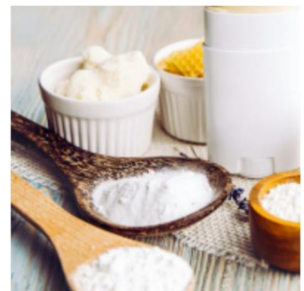
Flyer streubar