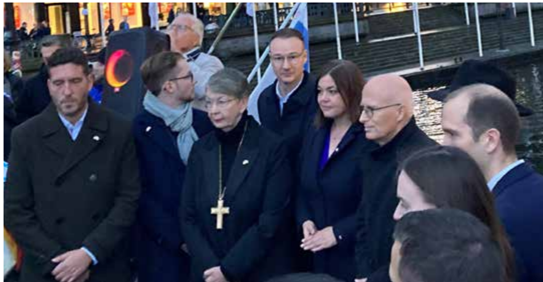
Landesbischöfin Kühnbaum-Schmidt (Mitte) bekundete ihre Solidarität mit den Menschen in Israel.

Frieden in der Welt uns leiten, dazu die richtigen Schritte zu finden und zu gehen.“